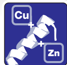
Organisch gebundene Spurenelemente